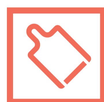
Planche à Partager