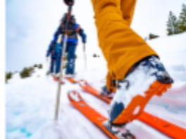
Le matériel sportif avec les meilleurs équipementiers