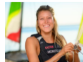
Encadrement tous niveaux par nos moniteurs