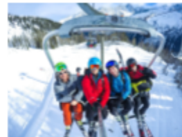
Forfait remontées mécaniques