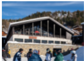
L'UCPA SPORT HOSTEL