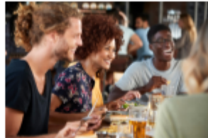
Les repas : Petit-déjeuner, déjeuner, dîner