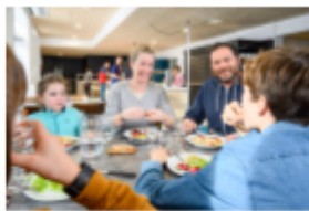
Les repas : Petit-déjeuner, déjeuner, dîner