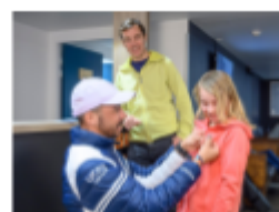
L'école de ski UCPA pour les enfants, les ados et les parents