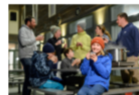
Des temps forts pour les enfants et des moments privilégiés en famille