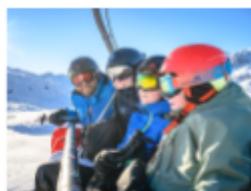
Forfait remontées mécaniques 6,5 jours