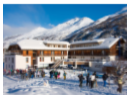
Hébergement de type hostel