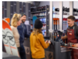
Le matériel sportif avec les meilleurs équipementiers 6,5 jours