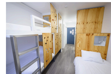
Chambre 3 pers. CABINE