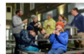
Des temps forts pour les enfants et des moments privilégiés en famille