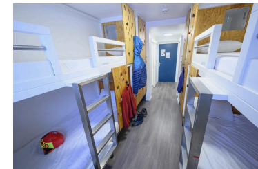
Chambre 4 pers. CABINE