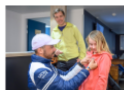
L'école de ski UCPA pour les enfants, les ados et les parents