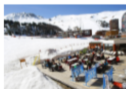
Hébergement au pied des pistes