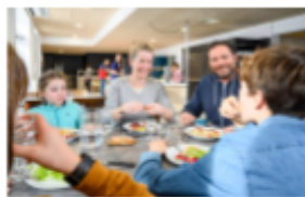
Les repas : Petit-déjeuner, déjeuner, dîner