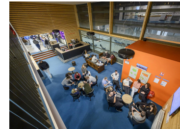
Agora vue terrasse